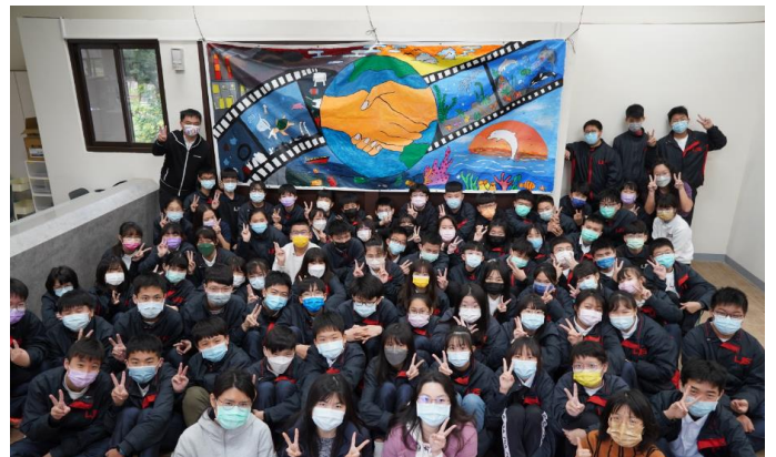
『アートマイル国際協働学習プロジェクト』Lu Jiang International school と壁画制作 (2年生)