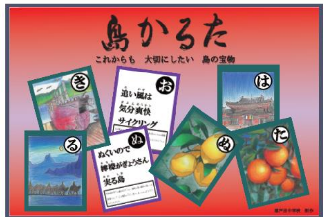
『島かるた』制作 (3年生)