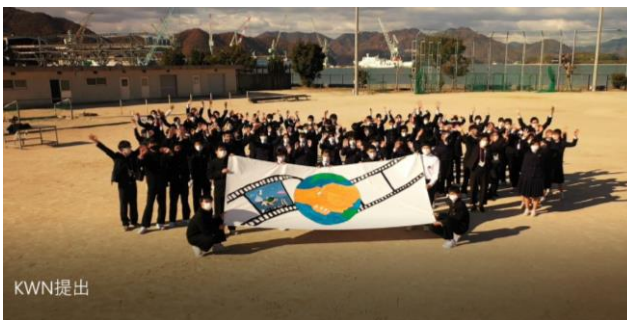
パナソニック財団主催『KWN日本コンテスト』動画制作 (2年生)